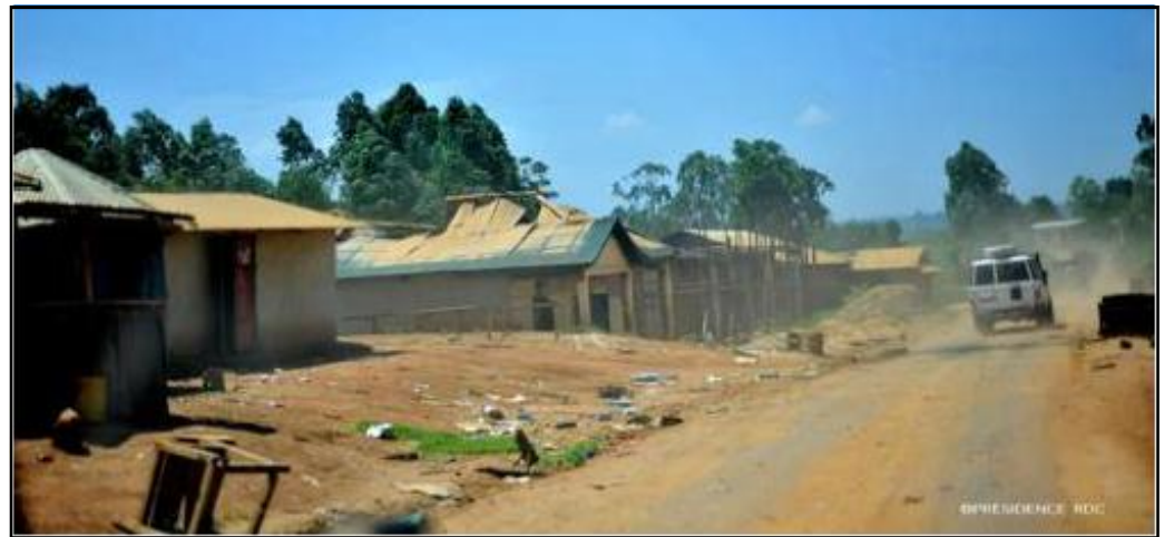
Un village du territoire de Djugu le 1er juillet 2019.

Quatre personnes, dont une femme, ont été tuées dimanche 21 juin, par des miliciens de CODECO, dans le village Olo, en territoire de Djugu (Ituri). Selon la société civile de Bahema-Nord, les victimes qui circulaient dans le milieu sont tombées dans différentes embuscades tendues par ces hommes armés.