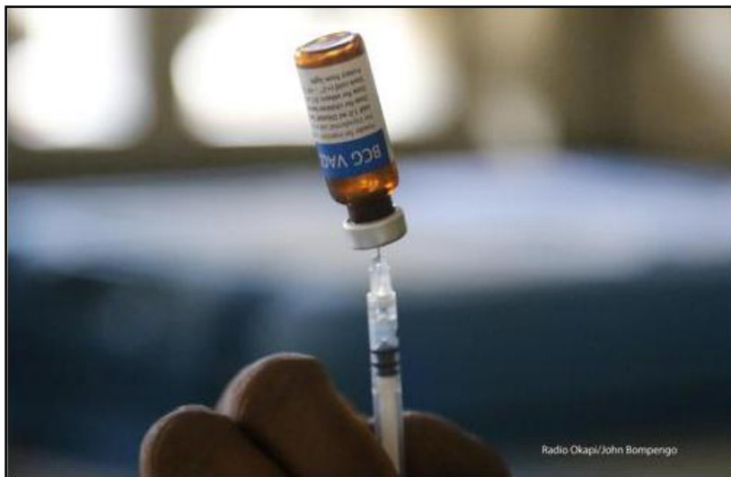
Vaccin pour enfant lors de la séance de vaccination des enfants soutenue par l'UNICEF au centre de santé de référence Matete dans la commune de Mangobo à Kisangani le 17/09/2019.

Afin que tous les enfants puissent être vaccinés et pour éviter un risque d'émergence d'épi-