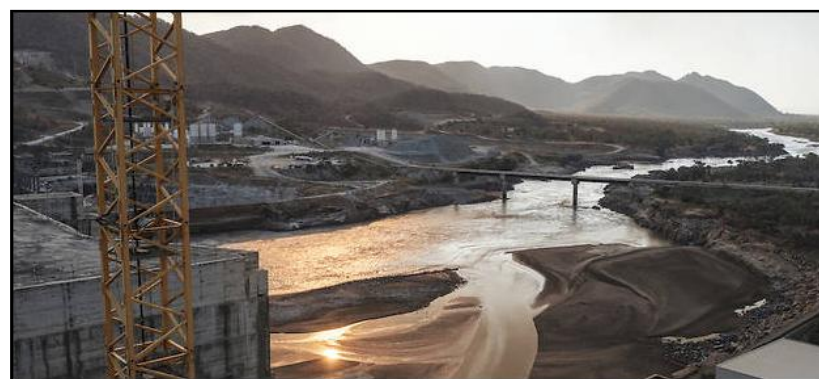
Le barrage de la Renaissance met en tension le Soudan, l'Éthiopie et l'Égypte.