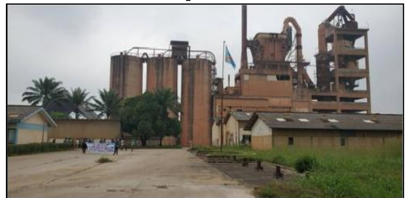
Cimenterie Nationale(CINAT) le 22/06/2020.

Le ministre de l'Industrie, Julien Paluku, envisage une relance « urgente » des activités de la Cimenterie nationale (CINAT). Il l'a dit lundi 22 juin lors de sa visite d'inspection au sein de cette cimenterie dont les activités ont été arrêtées depuis 2011.