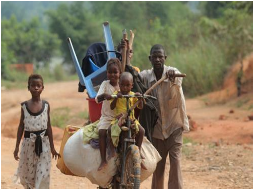
Une famille fuyant les violences au Kasai, en République démocratique du Congo.

La recrudescence de la violence au Kasai, en République démocratique du Congo (RDC), pourrait provoquer de nouveaux déplacements massifs de population, a averti vendredi l'Agence des Nations Unies pour les réfugiés (HCR) qui plaide pour que l'on se concentre à nouveau sur cette province pour rétablir la paix et désamorcer les tensions.