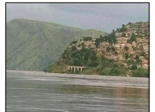
Vue de la partie Ouest de la ville de Matadi (Kongo-Central).

Mais, l'effectif des policiers commis pour les acheminer est moindre, étant donné qu'ils le font à pied. Ces policiers n'ont pu acheminer que 36 sur les 67 attendus pour la comparution. Vers 18h00, heure locale, ces cinq policiers ont religoté