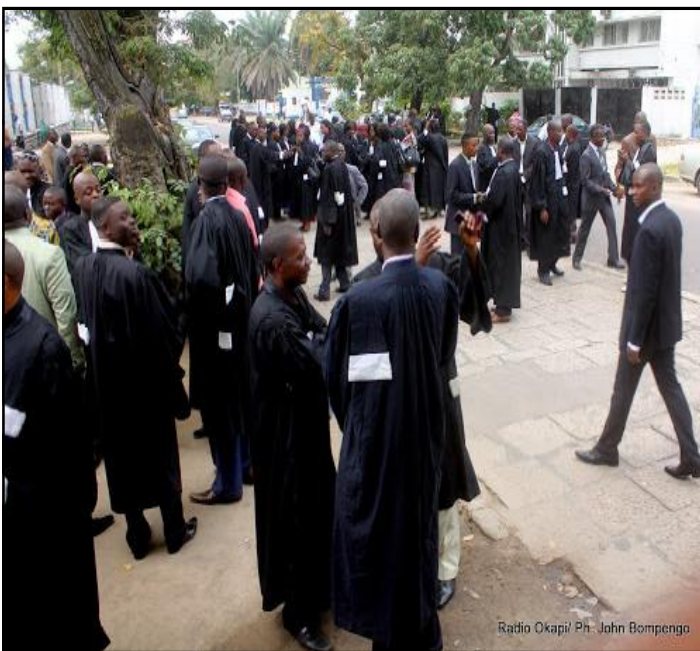
Des magistrats devant la primature, lors d'une marche de protestation contre leurs conditions de travail, mardi 30/09/2011.

Selon lui, cette dernière mise en place est venue encore créer un vide au sein de cette juridiction. Celle-ci comptait seulement quatre magistrats (deux au tribunal et deux