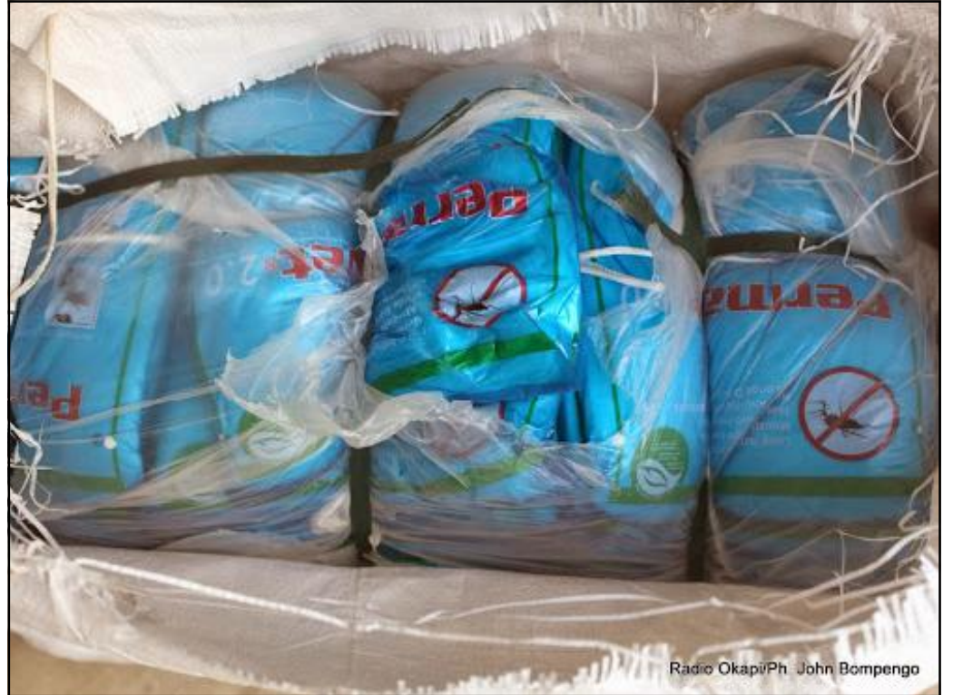
Un lot des moustiquaires imprégnées stocké au dépôt d'un centre de santé à Kinshasa, pour la distribution à la population par le Programme National de Lutte contre le Paludisme (PNLP).

Six millions de moustiquaires imprégnées d'insecticide à longue durée seront distribuées gratuitement à tous les ménages de la ville province de Kinshasa dans les deux prochains mois, a annoncé la ministre provinciale de la santé, jeudi 3 août après sa rencontre avec ses partenaires. Cette distribution est prévue dans le cadre du projet de la campagne de lutte contre le paludisme initié par le ministère de la santé en collaboration avec ses partenaires notamment le programme national de lutte contre le paludisme (PNLP) et la Santé rurale SANRU.