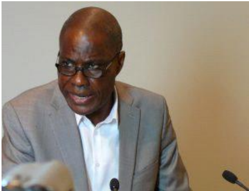
Martin Fayulu Madidi